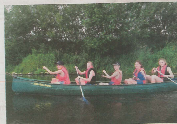
Die Kanutour auf der Lippe hat die jungen Pfadfinder begeistert.