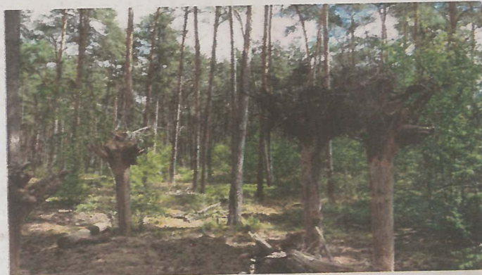
Verkehrte Welt - um die Wurzeln sichtbar zu machen, wurden diese Baumstümpfe in der Üfter Mark auf den Kopf gestellt.

Am vorletzten Tag des Lagers stand noch ein besonderer Programmpunkt auf der Tagesordnung: Für eine Führung im Naturschutzgebiet Üfter Mark wurden die Kinder und Jugendlichen mit Traktor und Planwagen abgeholt. Die Üfter Mark