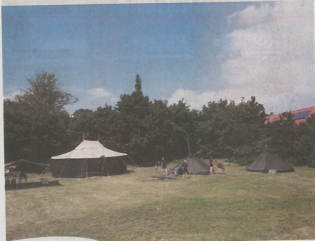
In diesen typischen Schwarzzelten essen und schlafen die Pfadfinder.

Die Corona-Pandemie drohte auch das Sommerlager der Sirius-Pfadfinder zu verhindern: Kurz vor den Sommerferien wurde der fest gebuchte Lagerplatz storniert.